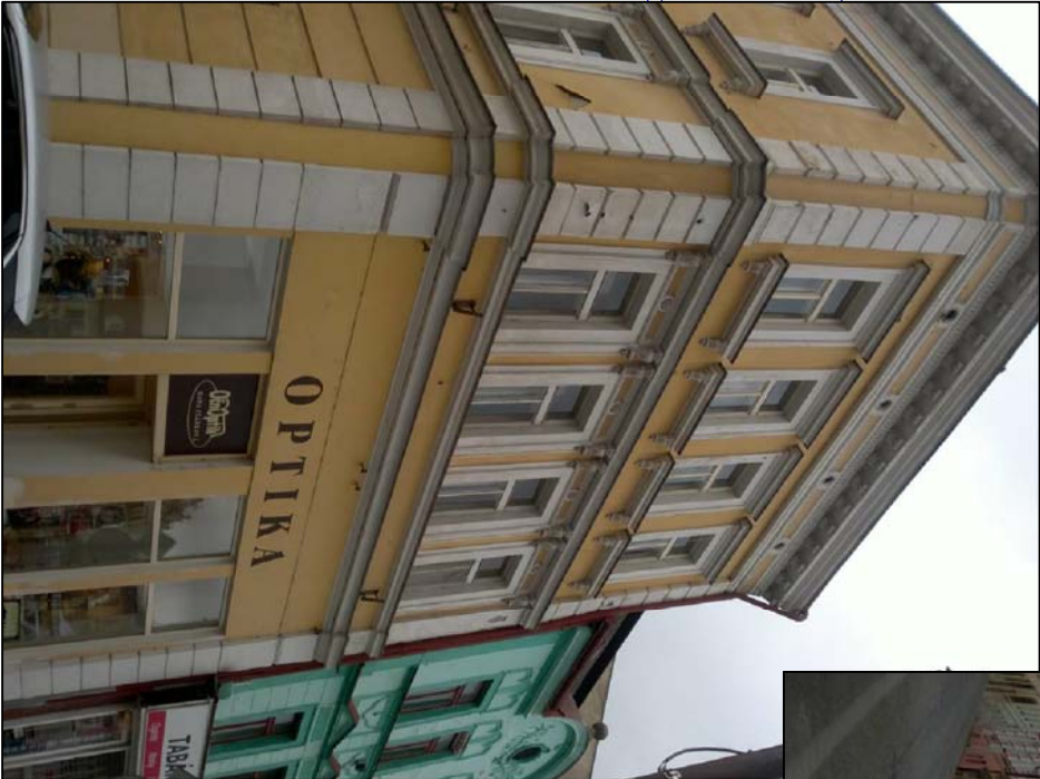
ULIČNÍ POHLED - B