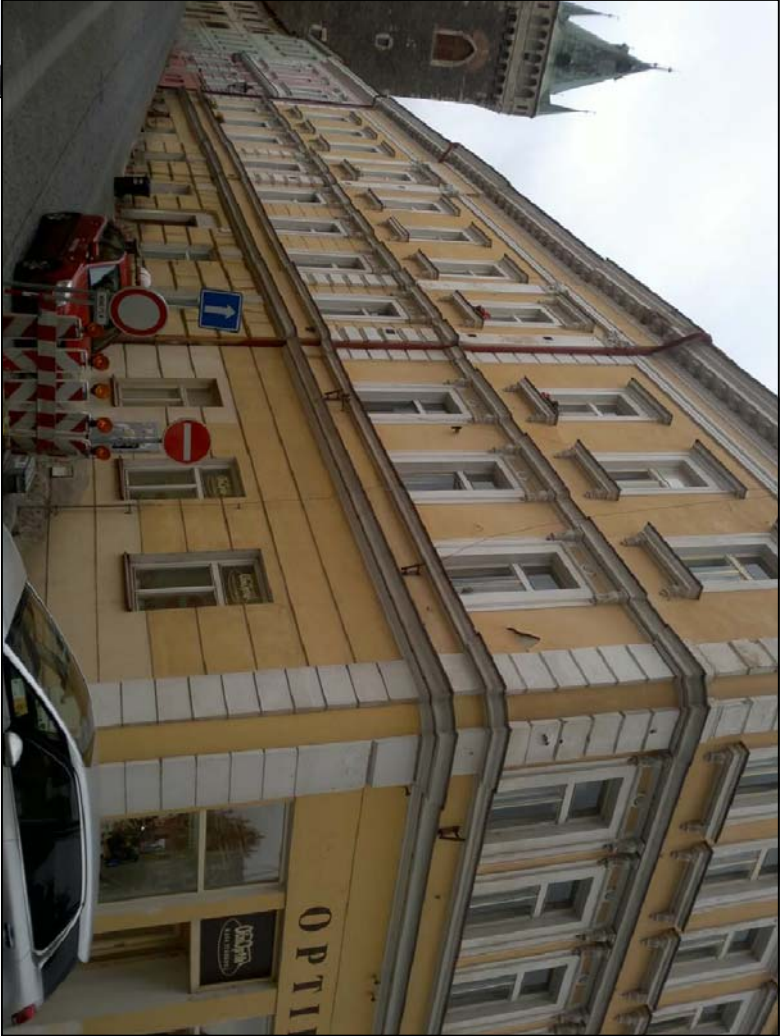
ULIČNÍ POHLED - A