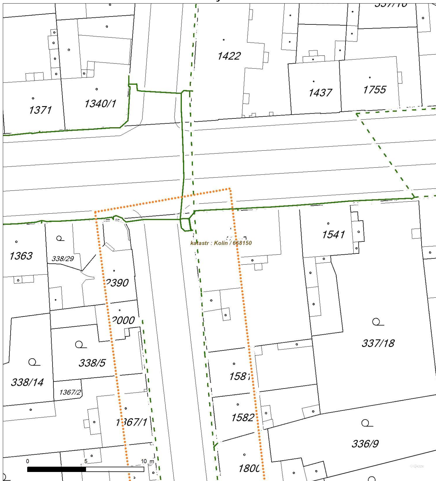
Situa ní výkres - list 1

Není-li zobrazena katastrální mapa, zadejte žádost znovu. Katastrální mapa je generována prostřednictvím externí WMS služby, jejíž provoz nezajišťuje společnost EZ Distribuce, a. s.