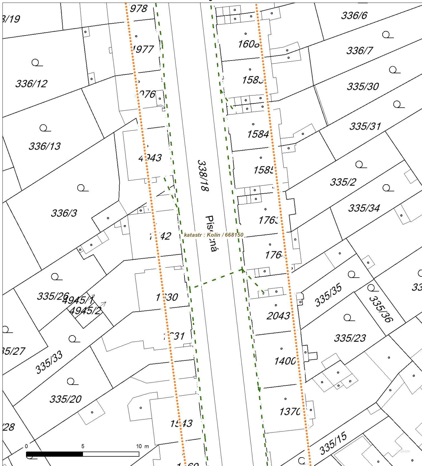
Situa ní výkres - list 2

Není-li zobrazena katastrální mapa, zadejte žádost znovu. Katastrální mapa je generována prost ednictvím externí WMS služby, jejíž provoz nezajiš uje spole nost EZ Distribuce, a. s.