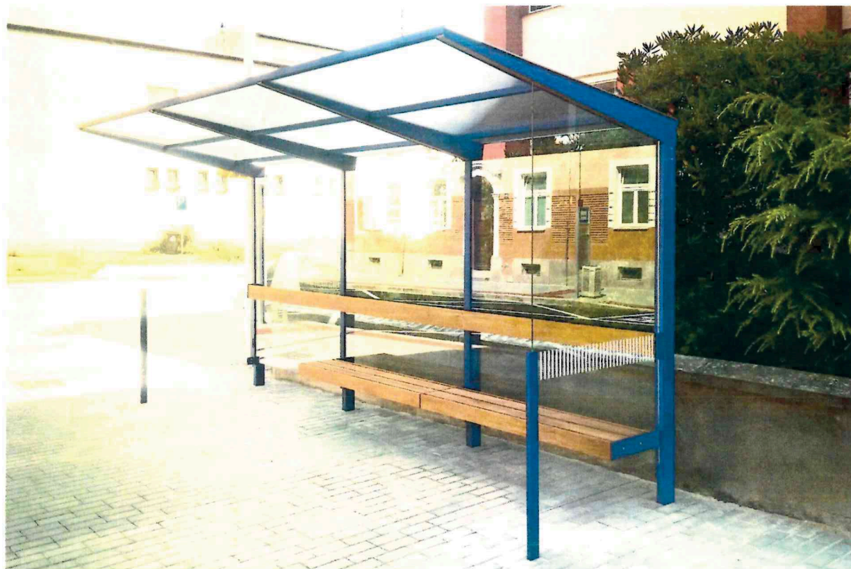
obrázek je pouze ilustrativní, nemusí přesně odpovídat popisovanému výrobku